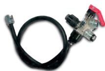
kit de aspiración