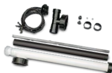
kit base de unión