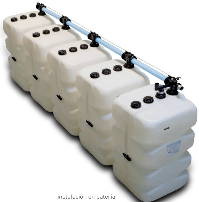
instalación en batería